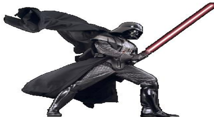
Clase Selector Poder Sith (especificidad): 0, 1, 0 (10)