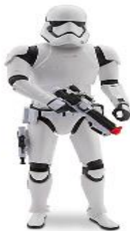
Elemento Selector Poder Sith (especificidad): 0, 0, 1 (1)