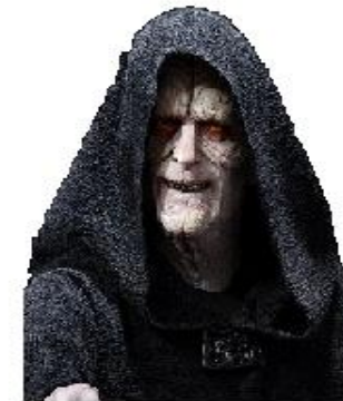
id selector Poder Sith (especificidad): 1, 0, 0 (100)